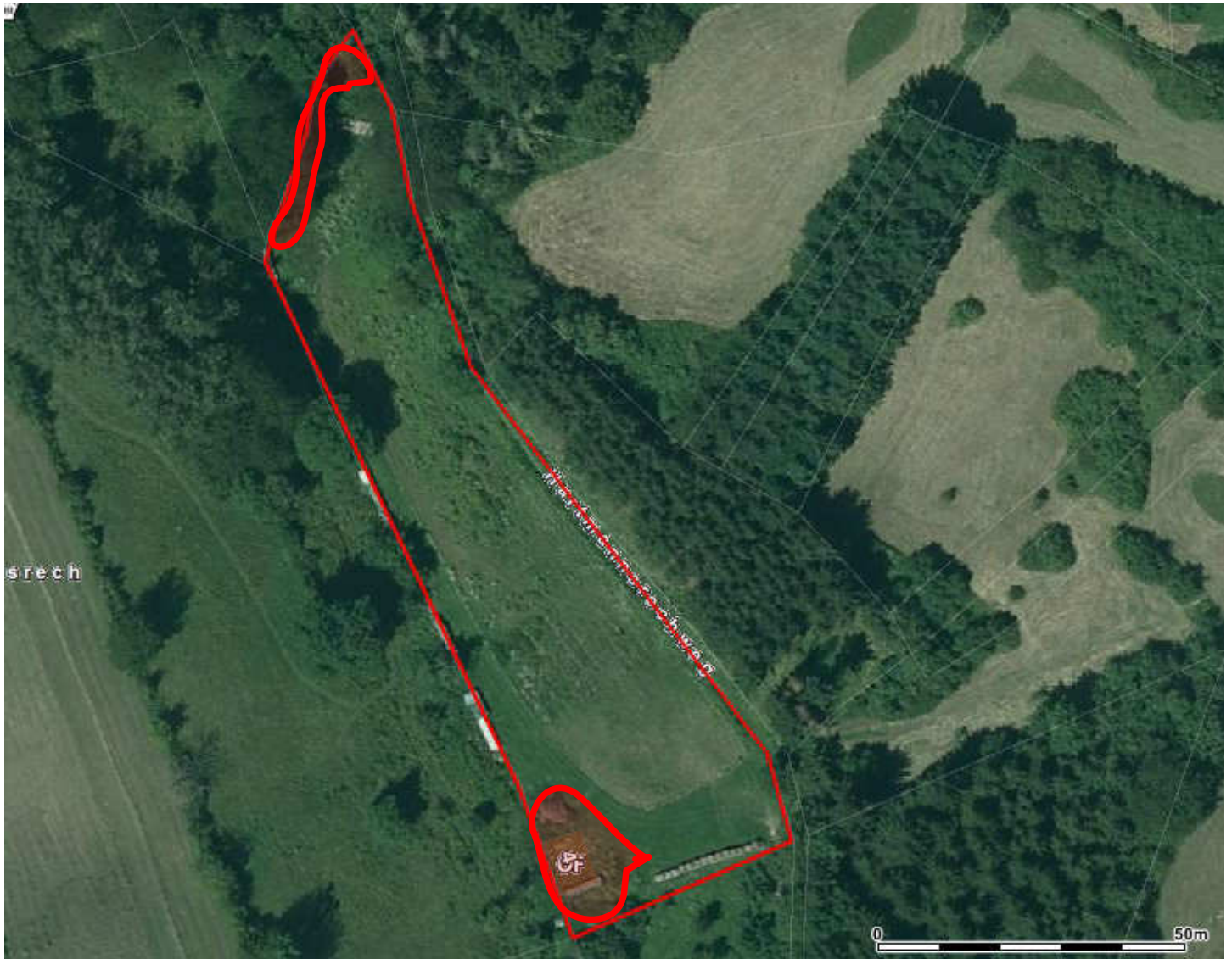
Bauschutt, Betontreppe, Eisenabfall