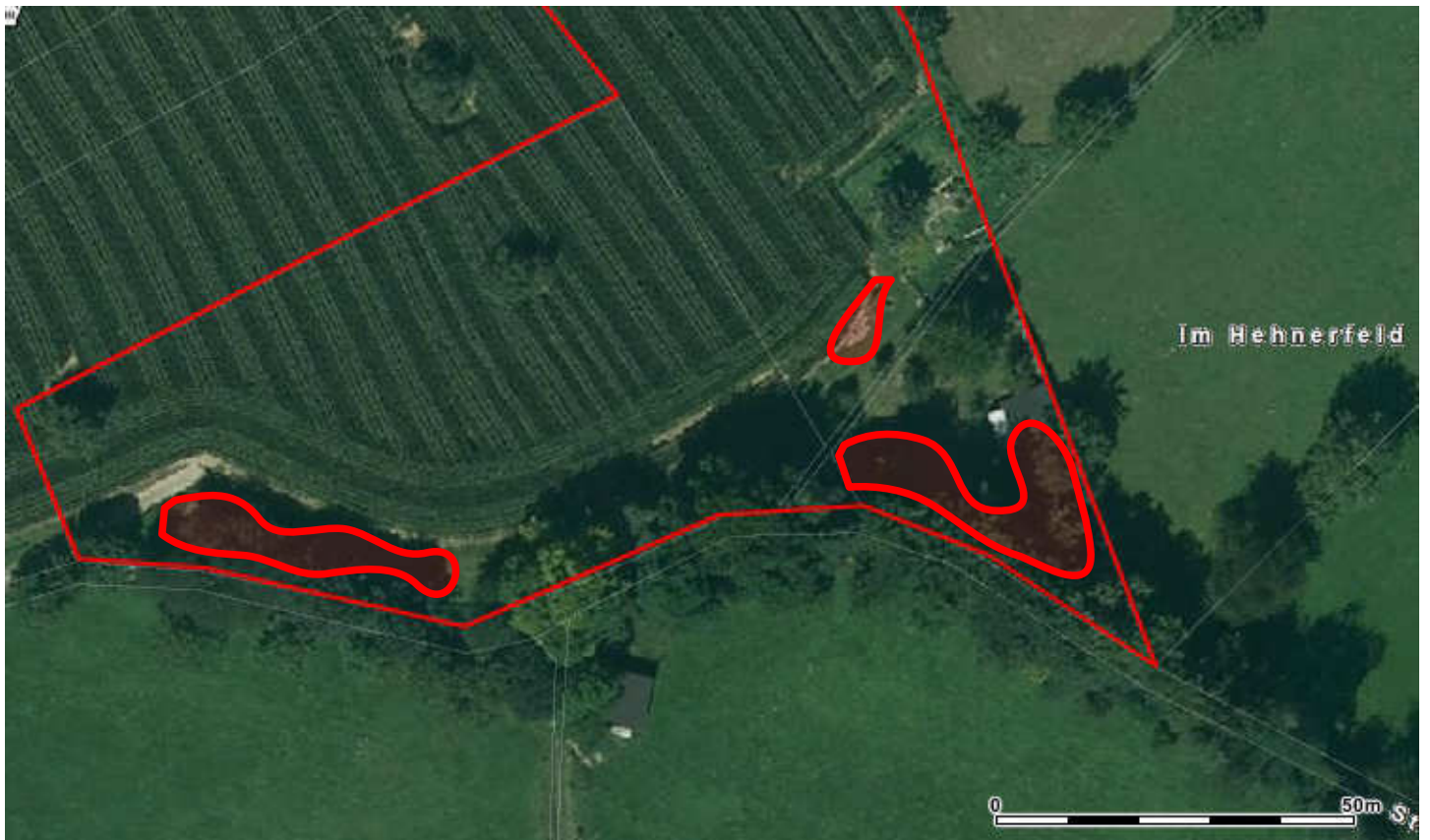
Bauschutt, Plastik, Maschinen